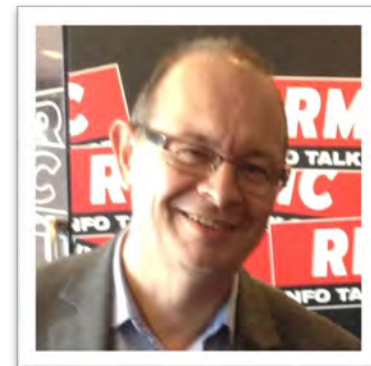
64 ans, marié, sept enfants

Côté politique, comme on se dit tout, je me suis promené, tout en ayant des responsabilités locales, dans deux partis, le Forum des Républicains Sociaux puis le Conseil National des Indépendants et Paysans. De toutes ces expériences politiques, dont la campagne présidentielle, j'en suis ressorti conforté que les partis politiques devaient disparaître et qu'il fallait laisser la place à des organisations de citoyens dont la motivation est la recherche du bien commun.